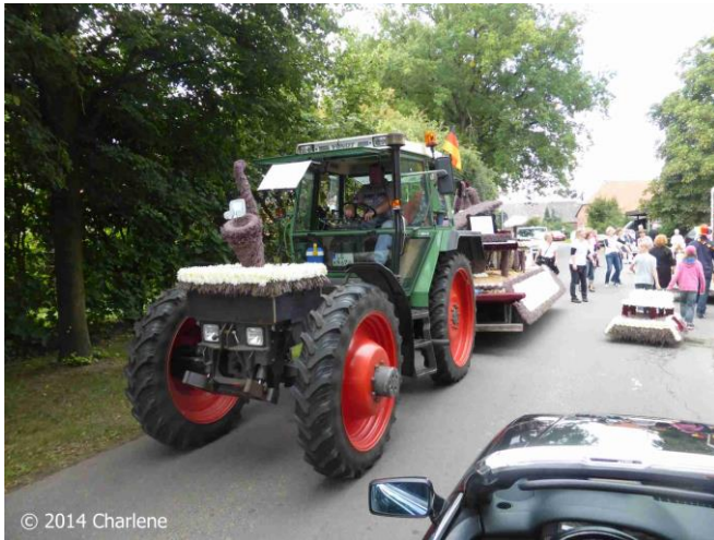
Der Piratenschatz war auch toll